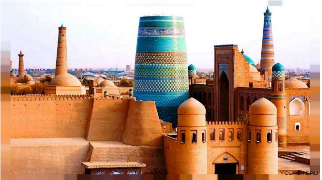
Kalta Minor. Xiva shahar