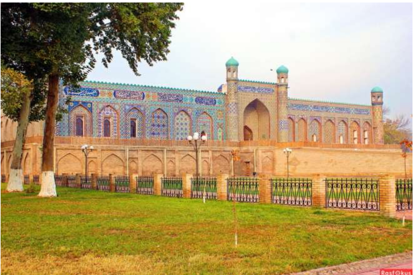
Xon O'rdasi. Qo'qon shahar