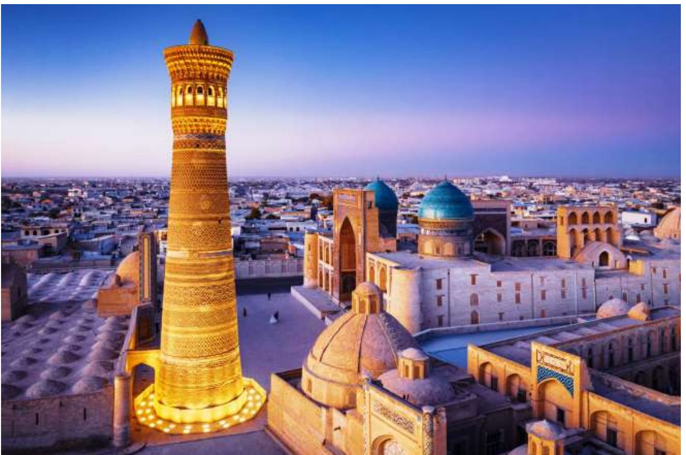
Minorai Kalon. Buxoro shahar