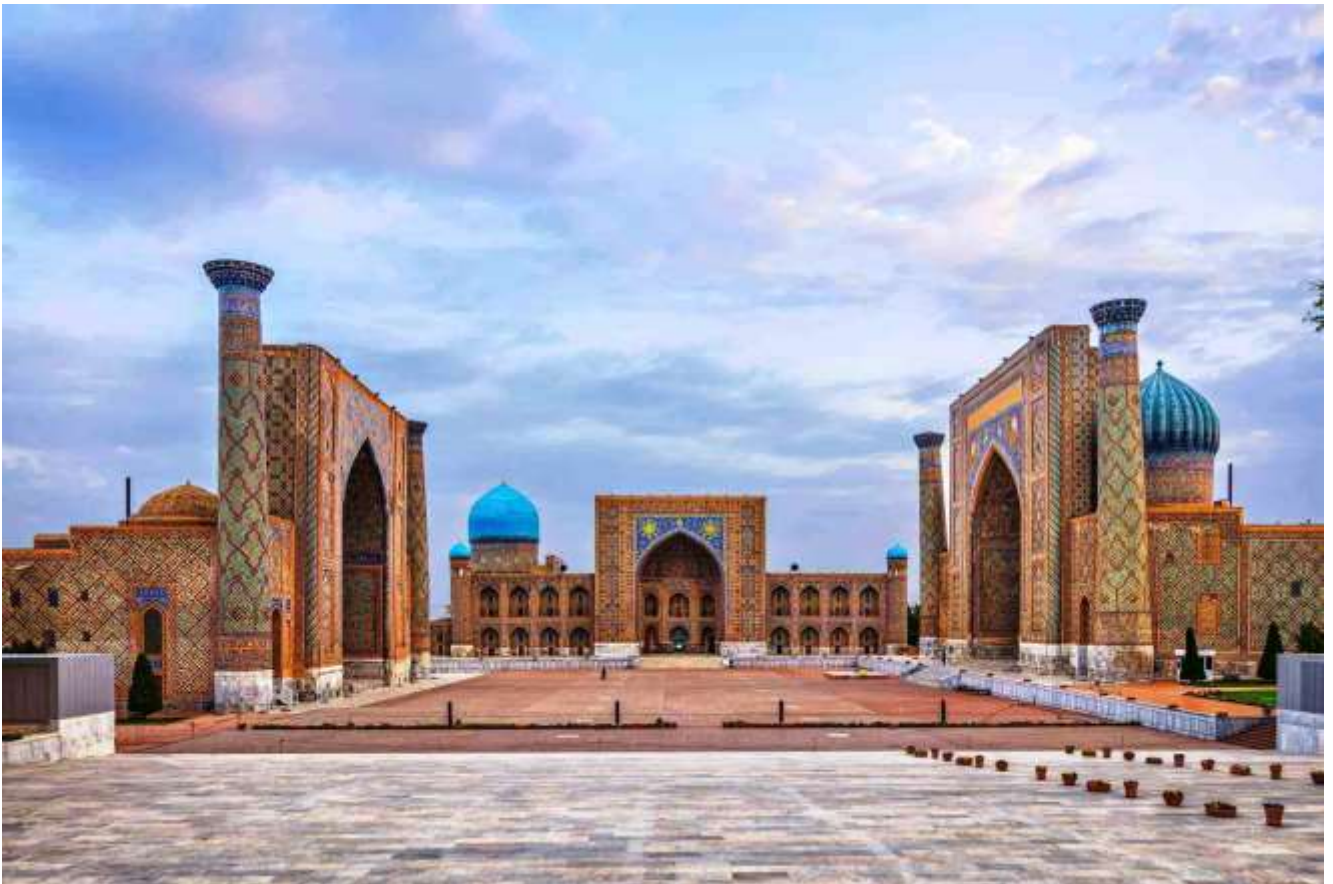
Registon maydoni. Samarqand shahar